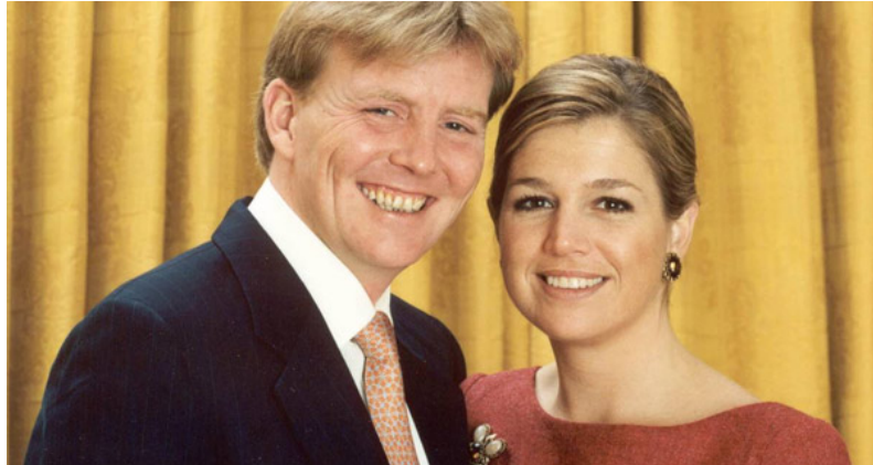
'Een beetje dom'